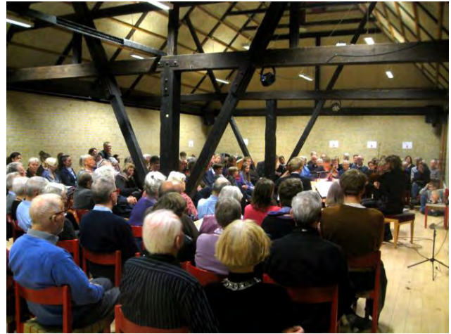
God stemning og fuldt hus til koncerten